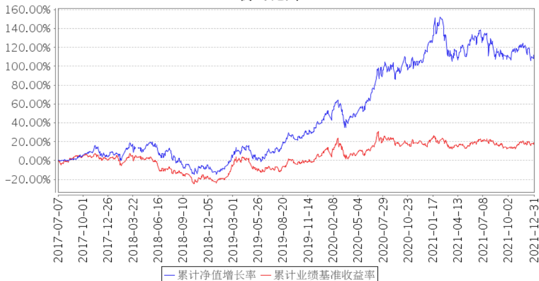
景顺长城沪港深领先科技股票累计净值增长率与同期业绩比较基准收益率的历史走势对比图

注：本基金的投资组合比例为：本基金股票投资占基金资产的比例范围为 80%–95%，其中投资于国内依法上市的股票比例不超过基金资产的 95%，投资于港股通标的股票比例不超过基金资产的 95%；除股票外的其他资产占基金资产的比例范围为 5%–20%，其中权证资产占基金资产净值的比例范围为 0–3%。本基金每个交易日日终在扣除股指期货合约需缴纳的交易保证金后，应当保持不低于基金资产净值 5% 的现金或者到期日在一年以内的政府债券。本基金投资于领先科技主题的股票资产不低于非现金基金资产的 80%。本基金的建仓期为自 2017 年 7 月 7 日基金合同生效日起 6 个月。建仓期结束时，本基金投资组合达到上述投资组合比例的要求。