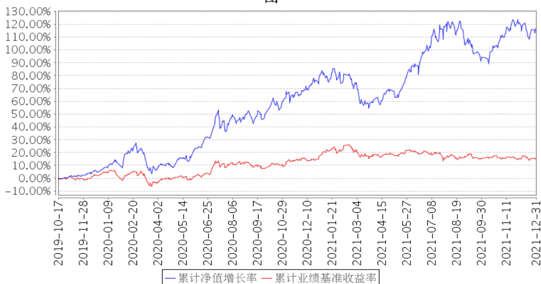
景顺长城创新成长混合累计净值增长率与同期业绩比较基准收益率的历史走势对比图

注：基金的投资组合比例：股票投资占基金资产的比例范围为 50%–95%，其中投资于本基金界定的“创新成长”主题相关证券的比例不低于非现金基金资产的 80%，投资于港股通标的股票比例不超过股票资产的 50%。本基金每个交易日日终在扣除股指期货合约需缴纳的交易保证金后，应当保持不低于基金资产净值 5% 的现金或者到期日在一年以内的政府债券，其中现金不包括结算备付金、存出保证金和应收申购款等。权证、股指期货及其他金融工具的投资比例依照法律法规或监管机构的规定执行。本基金的建仓期为自 2019 年 10 月 17 日基金合同生效日起 6 个月。建仓期结束时，本基金投资组合达到上述投资组合比例的要求。