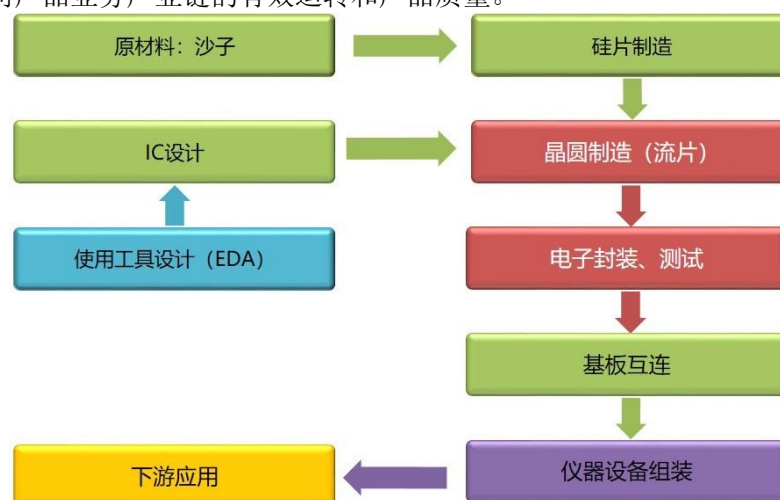
半导体产业链示意图

公司主业属于集成电路设计业，采用无晶圆生产线的集成电路设计模式（Fabless）。公司进行集成电路的设计和营销，将晶圆加工、电路封装和测试等生产环节分别外包给专业的晶圆加工企业、封装和测试企业来完成。公司与国内主要的晶圆加工、封装测试厂商长期保持了良好的合作关系，保证了公司产品业务产业链的有效运转和产品质量。