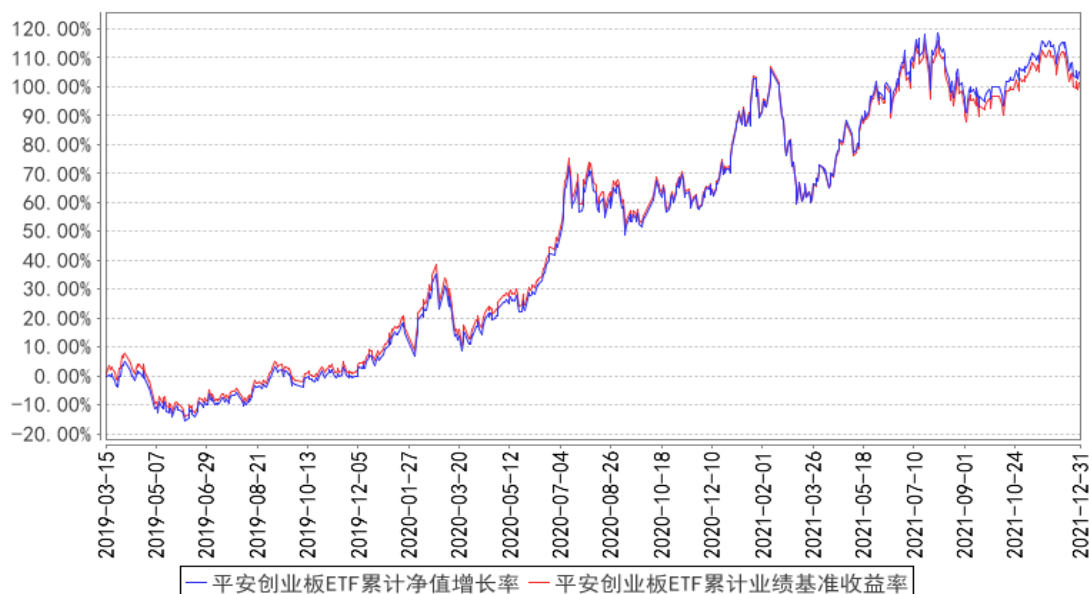
平安创业板ETF累计净值增长率与同期业绩比较基准收益率的历史走势对比图