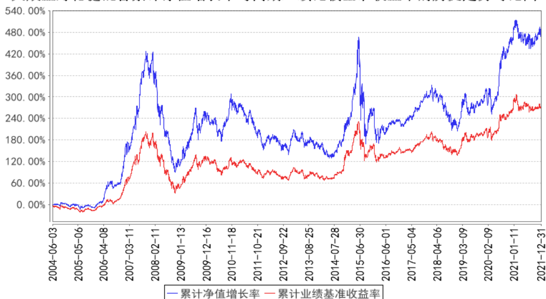
大成蓝筹稳健混合累计净值增长率与同期业绩比较基准收益率的历史走势对比图

注：本基金合同规定，基金管理人应当自基金合同生效之日起六个月内使基金的投资组合比例符合基金合同的约定。建仓期结束时，本基金的投资组合比例符合基金合同的约定。