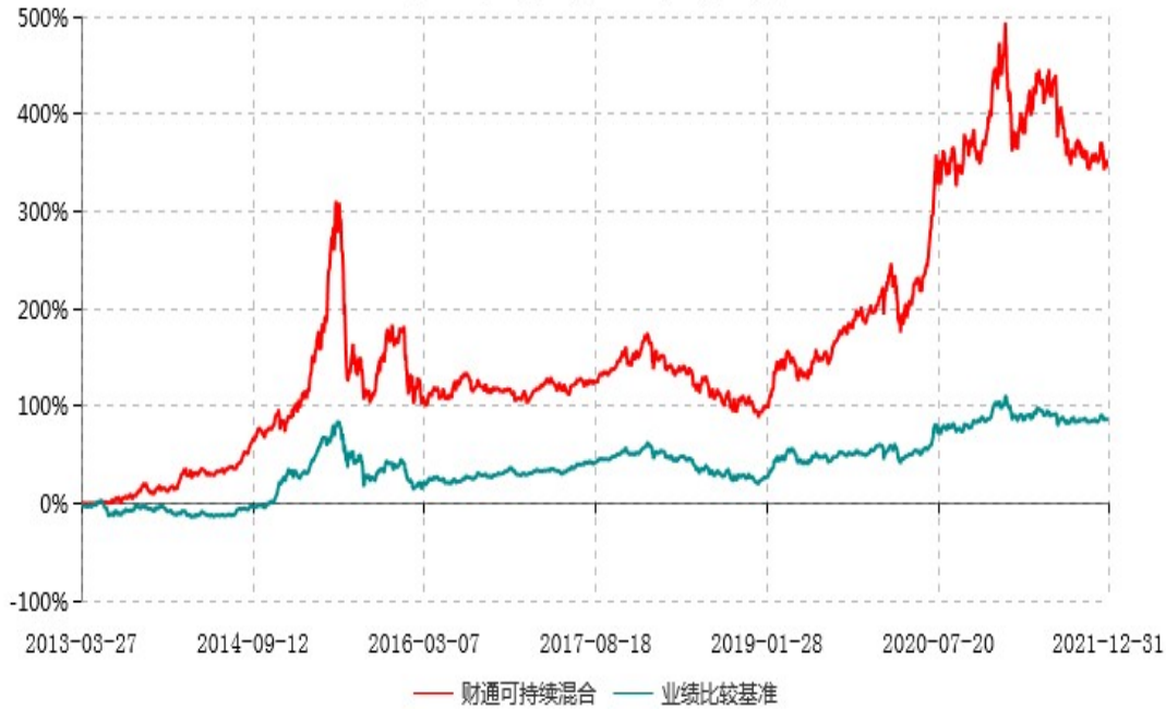
财通可持续发展主题混合型证券投资基金累计净值增长率与业绩比较基准收益率历史走势对比图 (2013年03月27日-2021年12月31日)