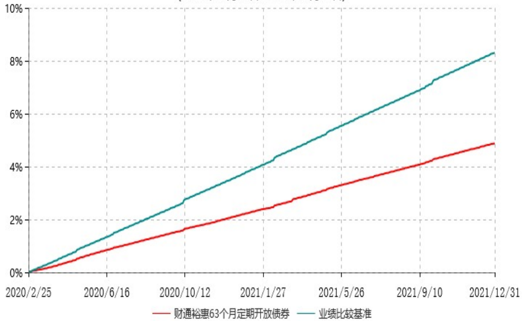
财通裕惠63个月定期开放债券型证券投资基金累计净值增长率与业绩比较基准收益率历史走势对比图 (2020年02月25日-2021年12月31日)