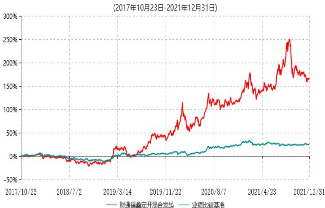
财通多策略福鑫定期开放灵活配置混合型发起式证券投资基金累计净值增长率与业绩比较基准收益率历史走势对比图