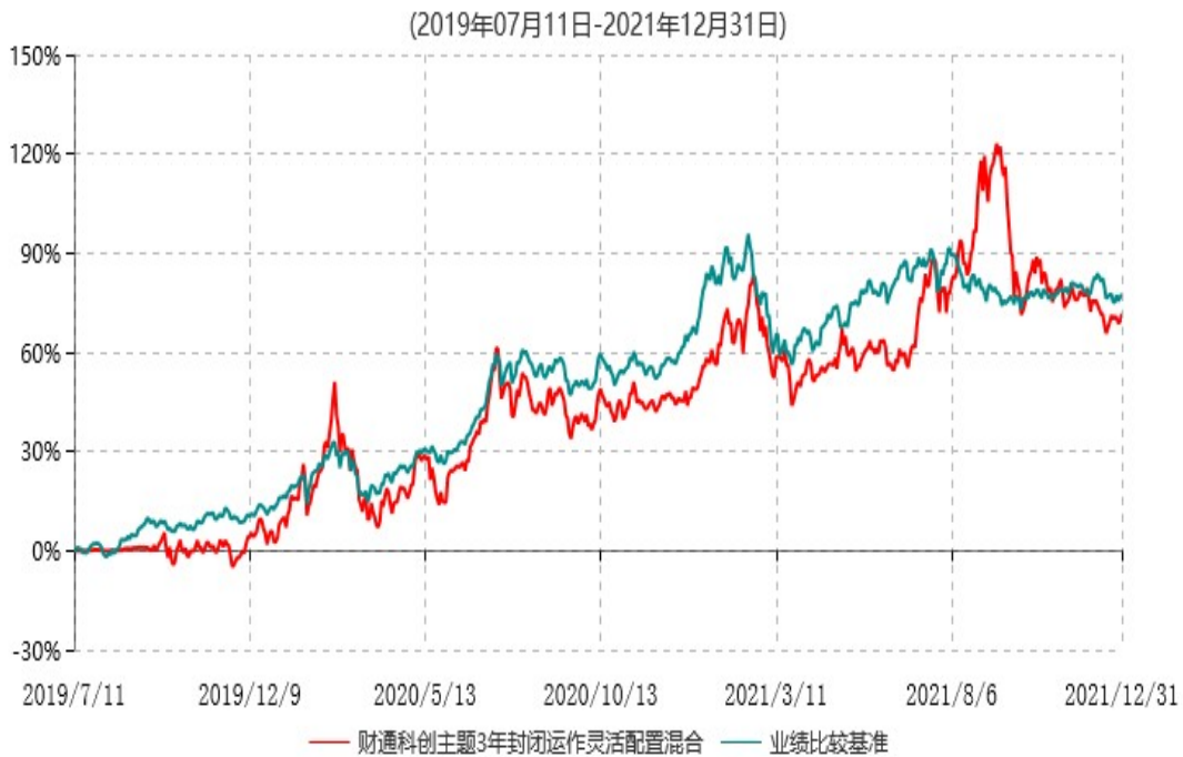
财通科创主题3年封闭运作灵活配置混合型证券投资基金累计净值增长率与业绩比较基准收益率历史走势对比图