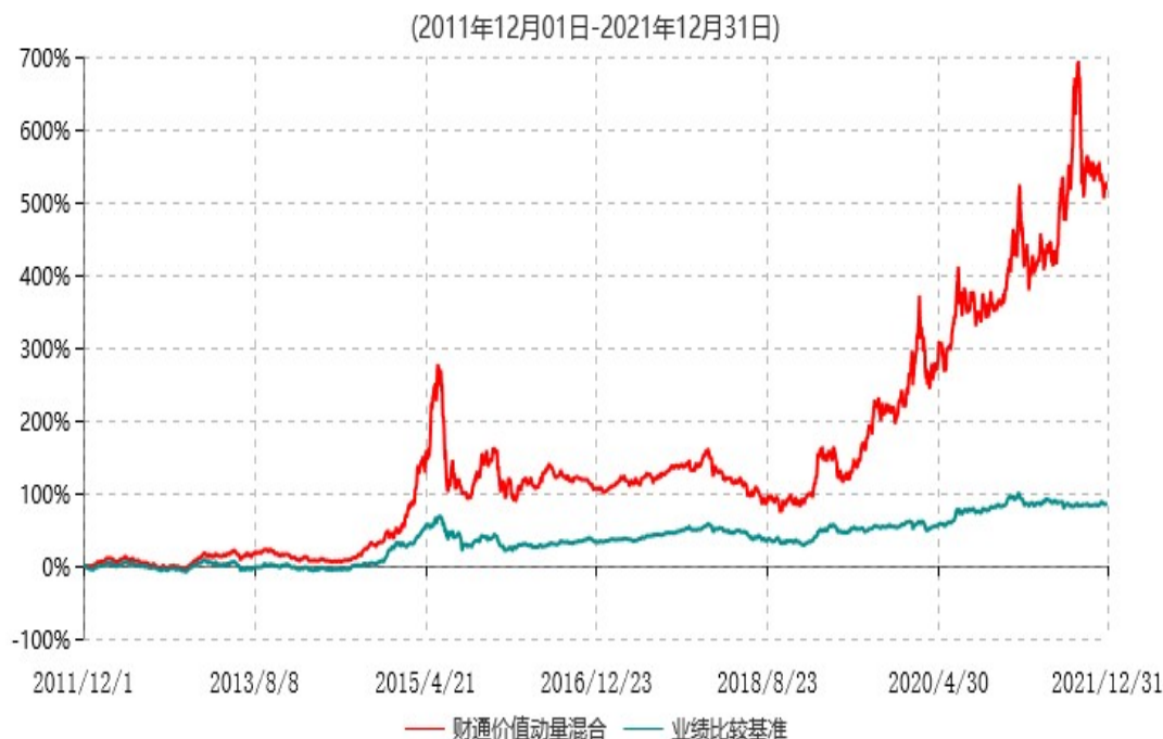
财通价值动量混合型证券投资基金累计净值增长率与业绩比较基准收益率历史走势对比图