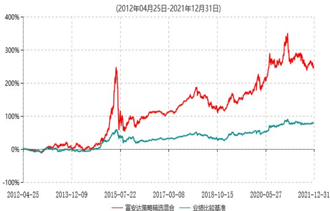
富安达策略精选灵活配置混合型证券投资基金累计净值增长率与业绩比较基准收益率历史走势对比图