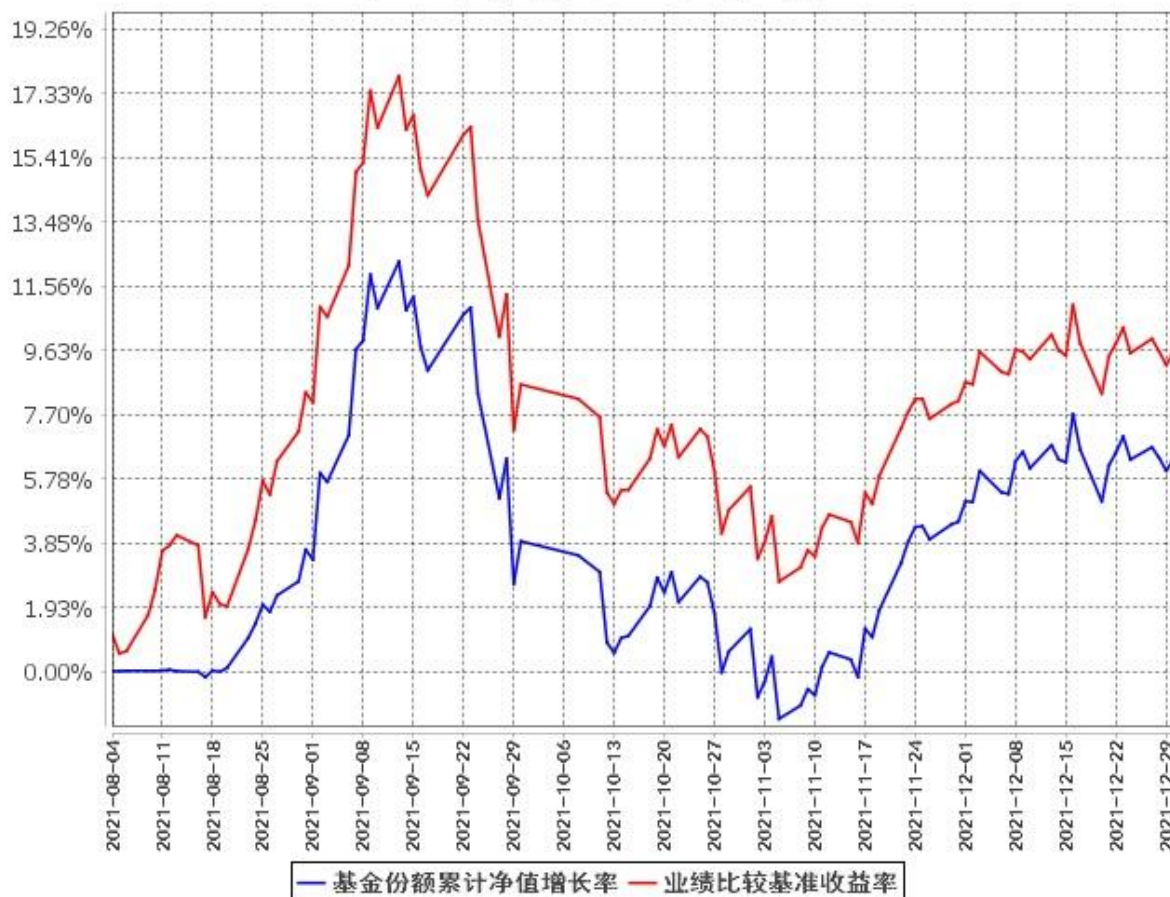
基金份额累计净值增长率与同期业绩比较基准收益率的历史走势对比图 (2021年8月4日至2021年12月31日)

注：(1)本基金合同于 2021 年 8 月 4 日生效，截至报告期末基金合同生效未满一年。