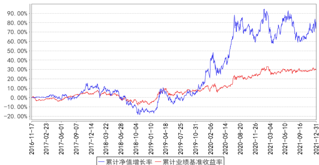
银华体育文化灵活配置混合累计净值增长率与同期业绩比较基准收益率的历史走势对比图

注：按基金合同的规定，本基金自基金合同生效起六个月为建仓期，建仓期结束时本基金的各项资产配置比例已达到基金合同的规定：股票资产占基金资产的 0%-95%，其余投资债券、资产支持证券、债券回购、非金融企业债务融资工具、同业存单、银行存款（包括协议存款、定期存款及其他银行存款）、现金、权证、股指期货等金融工具，其中投资于本基金界定的体育、文化主题的上市公司股票和债券不低于非现金基金资产的 80%；权证投资比例为基金资产净值的 0%-3%；每个交易日日终，在扣除股指期货合约需缴纳的交易保证金后，应当保持不低于基金资产净值 5% 的现金或到期日在一年以内的政府债券。其中，现金不包括结算备付金、存出保证金、应收申购款等。