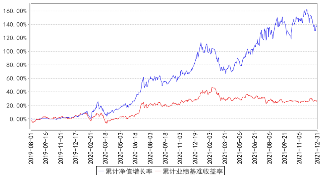
银华兴盛股票累计净值增长率与同期业绩比较基准收益率的历史走势对比图

注：按基金合同的规定，本基金自基金合同生效起六个月为建仓期，建仓期结束时本基金的各项资产配置比例已达到基金合同的规定：股票投资比例为基金资产的 80%-95%；每个交易日日终，在扣除股指期货合约需缴纳的交易保证金后，应当保持不低于基金资产净值 5%的现金或者到期日在一年以内的政府债券，其中，现金不包括结算备付金、存出保证金和应收申购款等。