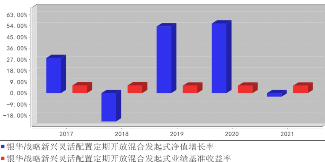
银华战略新兴灵活配置定期开放混合发起式基金每年净值增长率与同期业绩比较基准收益率的对比图