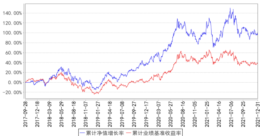
银华中证全指医药卫生指数增强发起式累计净值增长率与同期业绩比较基准收益率的历史走势对比图

注：按基金合同规定，本基金自基金合同生效起六个月内为建仓期，建仓期结束时本基金的各项投资比例已达到基金合同的规定：股票投资占基金资产的比例不低于 80%，其中投资于中证全指医药卫生指数成份股和备选成份股的资产占非现金基金资产的比例不低于 80%；每个交易日日终在扣除股指期货合约需缴纳的交易保证金后，应保持不低于基金资产净值 5% 的现金或者到期日在一年以内的政府债券。其中，现金不包括结算备付金、存出保证金、应收申购款等。为保持历史数据的延续性，本部分所涉自基金合同生效以来相关数据的计算以 2017 年 9 月 28 日（初始成立日）为起始日进行编制。