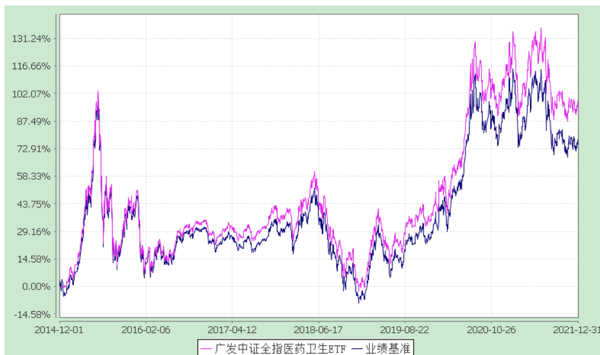
广发中证全指医药卫生交易型开放式指数证券投资基金 份额累计净值增长率与业绩比较基准收益率的历史走势对比图 (2014 年 12 月 1 日至 2021 年 12 月 31 日)