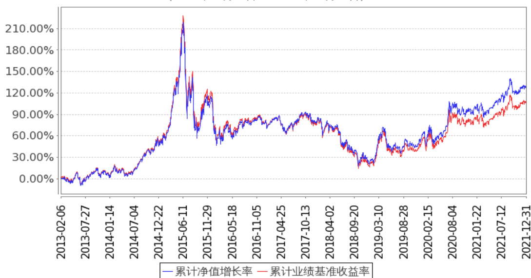
嘉实中证500ETF累计净值增长率与同期业绩比较基准收益率的历史走势对比图 (2013年02月06日至2021年12月31日)

注：按基金合同和招募说明书的约定，本基金自基金合同生效日起3个月为建仓期，建仓期结束时本基金的各项资产配置比例符合基金合同约定。