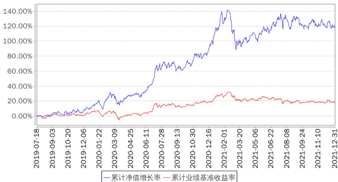
招商3年封闭瑞利混合累计净值增长率与同期业绩比较基准收益率的历史走势对比图