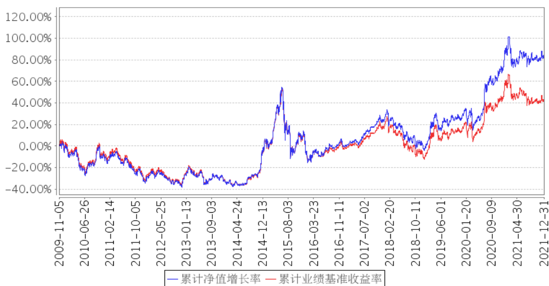
建信沪深300指数 (LOF) 累计净值增长率与同期业绩比较基准收益率的历史走势对比图