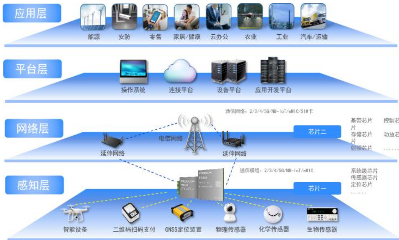
图1：物联网产业链及架构

公司自成立以来一直致力于物联网与移动互联网无线通信技术和应用的推广及其解决方案的应用拓展，在通信技术、射频技术、数据传输技术、信号处理技术上形成了较强的研发实力，是无线通信技术领域拥有自主知识产权的专业产品与方案提供商。公司在物联网产业链中处于网络层，并涉及与感知层的交叉领域，主要从事无线通信模块及其应用行业的通信解决方案的设计、研发与销售服务。