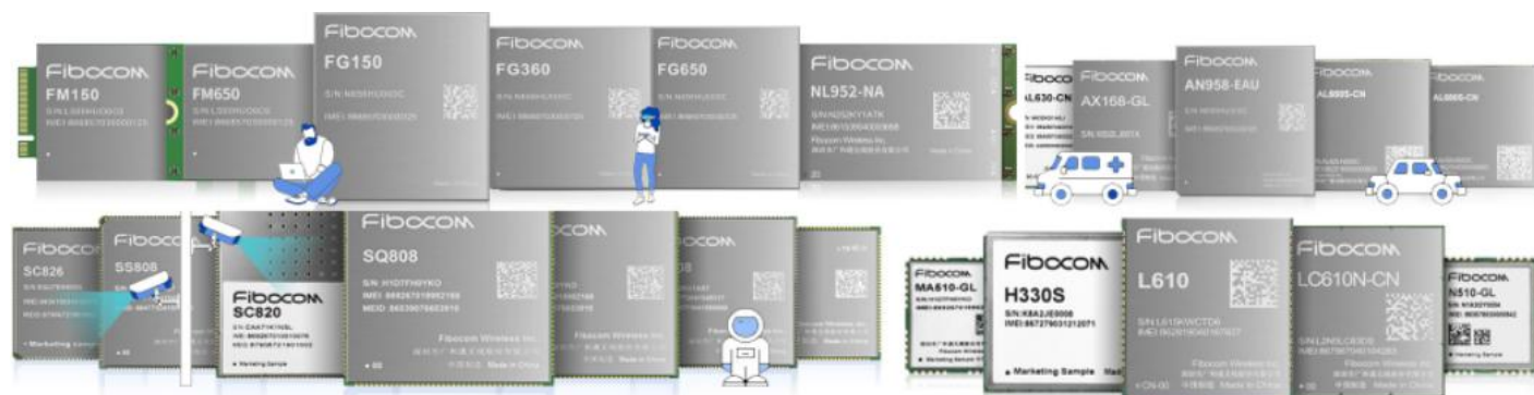
图2：公司主要产品图片

公司自成立以来一直致力于物联网与移动互联网无线通信技术和应用的推广及其解决方案的应用拓展，在通信技术、射频技术、数据传输技术、信号处理技术上形成了较强的研发实力，是无线通信技术领域拥有自主知识产权的专业产品与方案提供商。公司在物联网产业链中处于网络层，并涉及与感知层的交叉领域，主要从事无线通信模块及其应用行业的通信解决方案的设计、研发与销售服务。