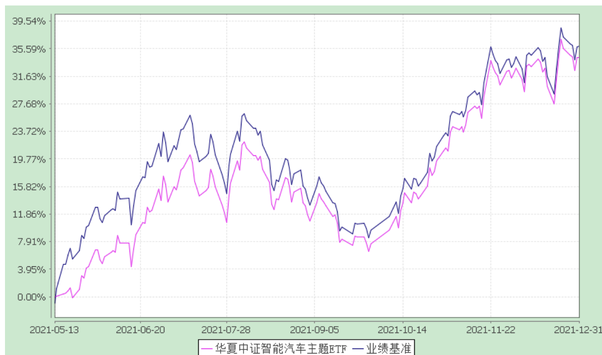
华夏中证智能汽车主题交易型开放式指数证券投资基金 份额累计净值增长率与业绩比较基准收益率的历史走势对比图 (2021 年 5 月 13 日至 2021 年 12 月 31 日)