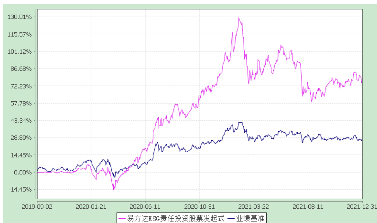
易方达 ESG 责任投资股票型发起式证券投资基金 份额累计净值增长率与业绩比较基准收益率历史走势对比图 (2019 年 9 月 2 日至 2021 年 12 月 31 日)

注：自基金合同生效至报告期末，基金份额净值增长率为 75.76%，同期业绩比较基准收益率为 27.96%。