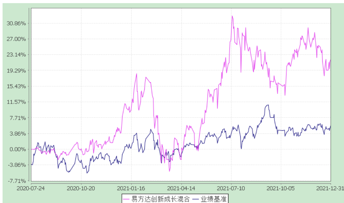
易方达创新成长混合型证券投资基金 份额累计净值增长率与业绩比较基准收益率历史走势对比图 (2020 年 7 月 24 日至 2021 年 12 月 31 日)

注：1.按基金合同和招募说明书的约定，本基金的建仓期为六个月，建仓期结束时投资两家公司发行的证券市值分别超过基金资产净值的 10%，为被动超标，已在规定的期限内调整完毕，其他各项资产配置比例符合基金合同（第十二部分二、投资范围，三、投资策略和四、投资限制）的有关约定。