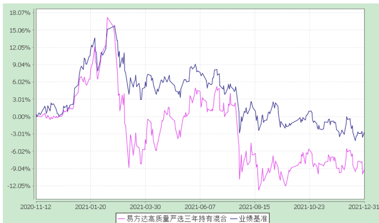
易方达高质量严选三年持有期混合型证券投资基金 份额累计净值增长率与业绩比较基准收益率历史走势对比图 (2020 年 11 月 12 日至 2021 年 12 月 31 日)

注：1.按基金合同和招募说明书的约定，本基金的建仓期为六个月，建仓期结束时各项资产配置比例符合基金合同（第十二部分二、投资范围，三、投资策略和四、投资限制）的有关约定。