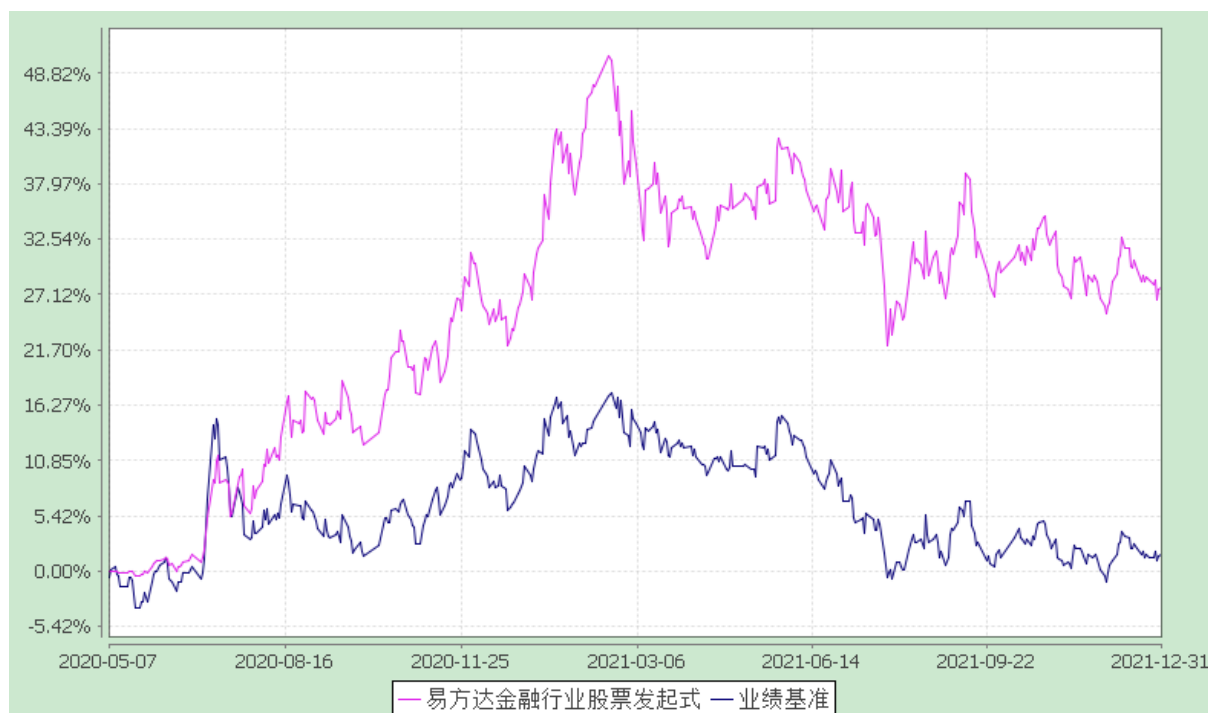
易方达金融行业股票型发起式证券投资基金 份额累计净值增长率与业绩比较基准收益率历史走势对比图 (2020年5月7日至2021年12月31日)

注：自基金合同生效至报告期末，基金份额净值增长率为 27.75%，同期业绩比较基准收益率为 1.59%。