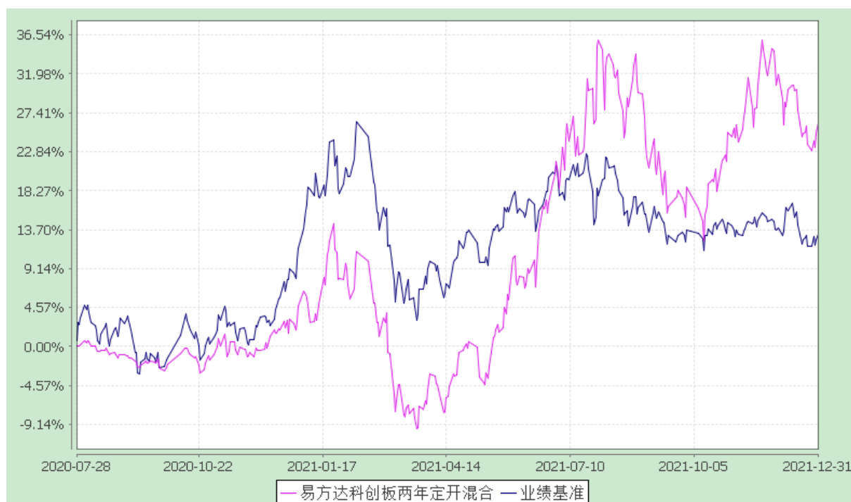
易方达科创板两年定期开放混合型证券投资基金 份额累计净值增长率与业绩比较基准收益率历史走势对比图 (2020年7月28日至2021年12月31日)

注：1.按基金合同和招募说明书的约定，本基金的建仓期为六个月，建仓期结束时各项资产配置比例符合基金合同（第十三部分二、投资范围，三、投资策略和四、投资限制）的有关约定。