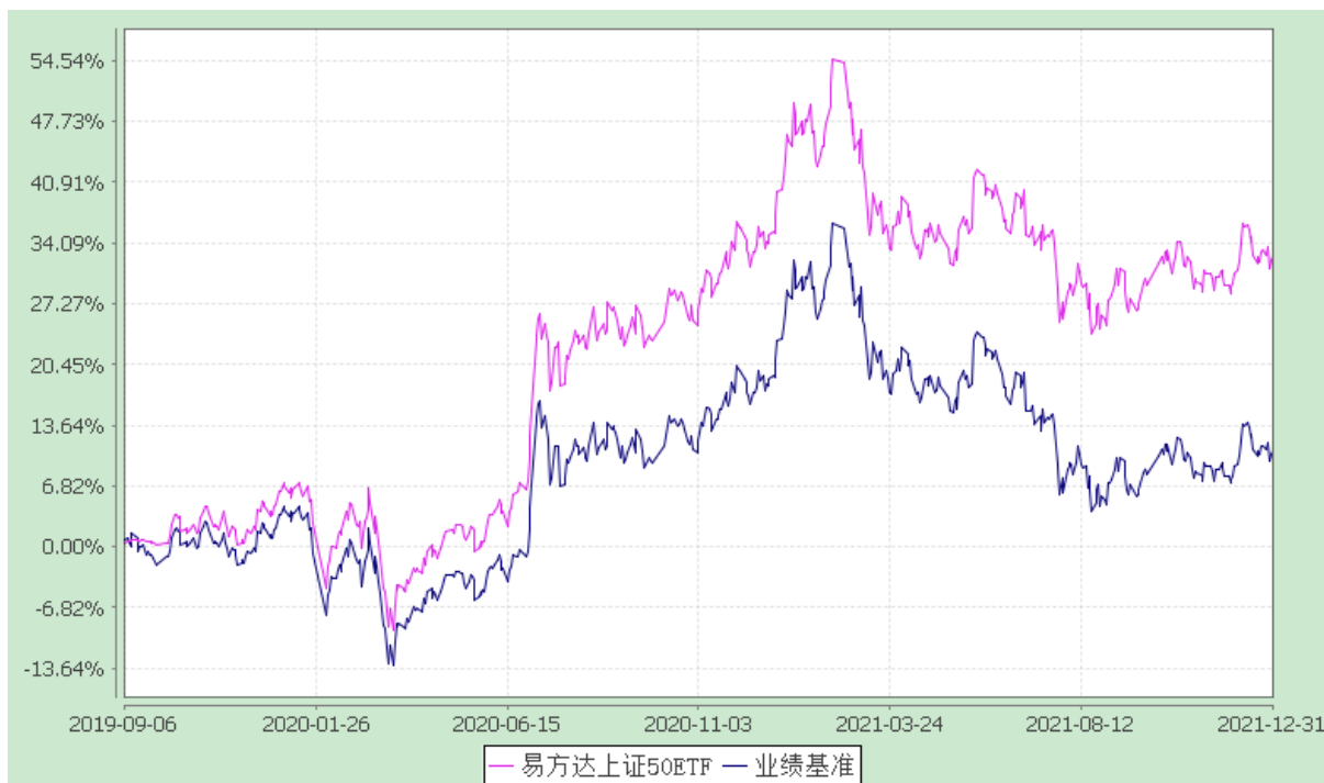
易方达上证 50 交易型开放式指数证券投资基金 份额累计净值增长率与业绩比较基准收益率历史走势对比图 (2019 年 9 月 6 日至 2021 年 12 月 31 日)

注：自基金合同生效至报告期末，基金份额净值增长率为 32.57%，同期业绩比较基准收益率为 10.77%。