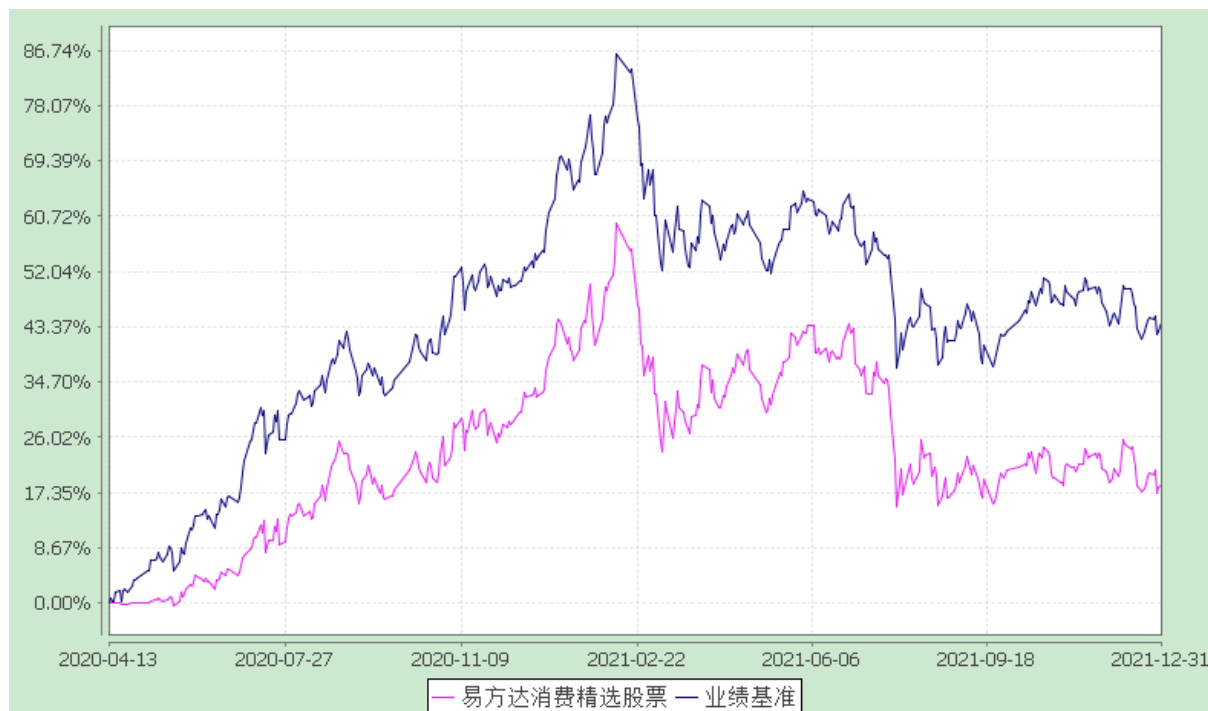
易方达消费精选股票型证券投资基金 份额累计净值增长率与业绩比较基准收益率历史走势对比图 (2020 年 4 月 13 日至 2021 年 12 月 31 日)

注：自基金合同生效至报告期末,基金份额净值增长率为 18.37%,同期业绩比较基准收益率为 44.09%。