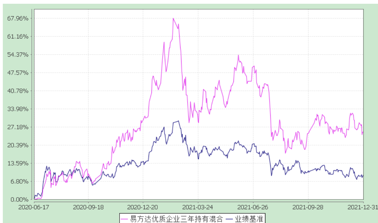
易方达优质企业三年持有期混合型证券投资基金 份额累计净值增长率与业绩比较基准收益率历史走势对比图 (2020年6月17日至2021年12月31日)

注：自基金合同生效至报告期末,基金份额净值增长率为 25.35%,同期业绩比较基准收益率为 9.15%。