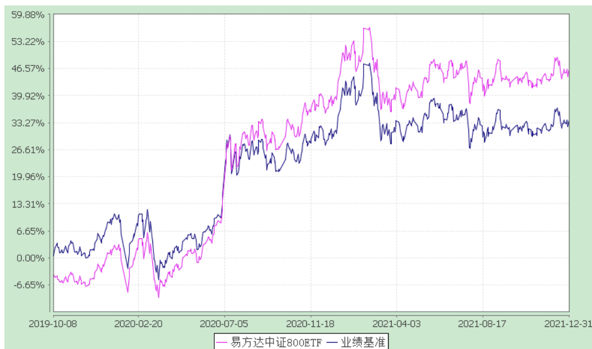
易方达中证 800 交易型开放式指数证券投资基金 份额累计净值增长率与业绩比较基准收益率历史走势对比图 (2019 年 10 月 8 日至 2021 年 12 月 31 日)

注：自基金合同生效至报告期末，基金份额净值增长率为 46.31%，同期业绩比较基准收益率为 33.84%。