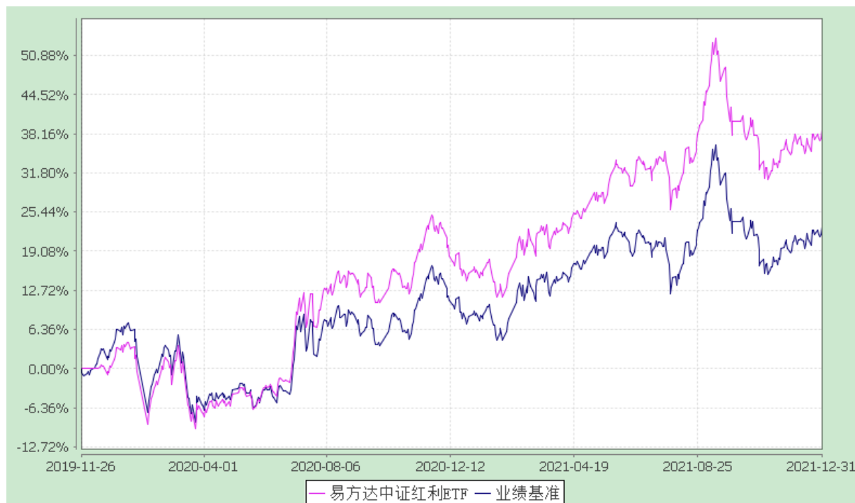
易方达中证红利交易型开放式指数证券投资基金 份额累计净值增长率与业绩比较基准收益率历史走势对比图 (2019年11月26日至2021年12月31日)

注：自基金合同生效至报告期末，基金份额净值增长率为 38.75%，同期业绩比较基准收益率为 23.02%。