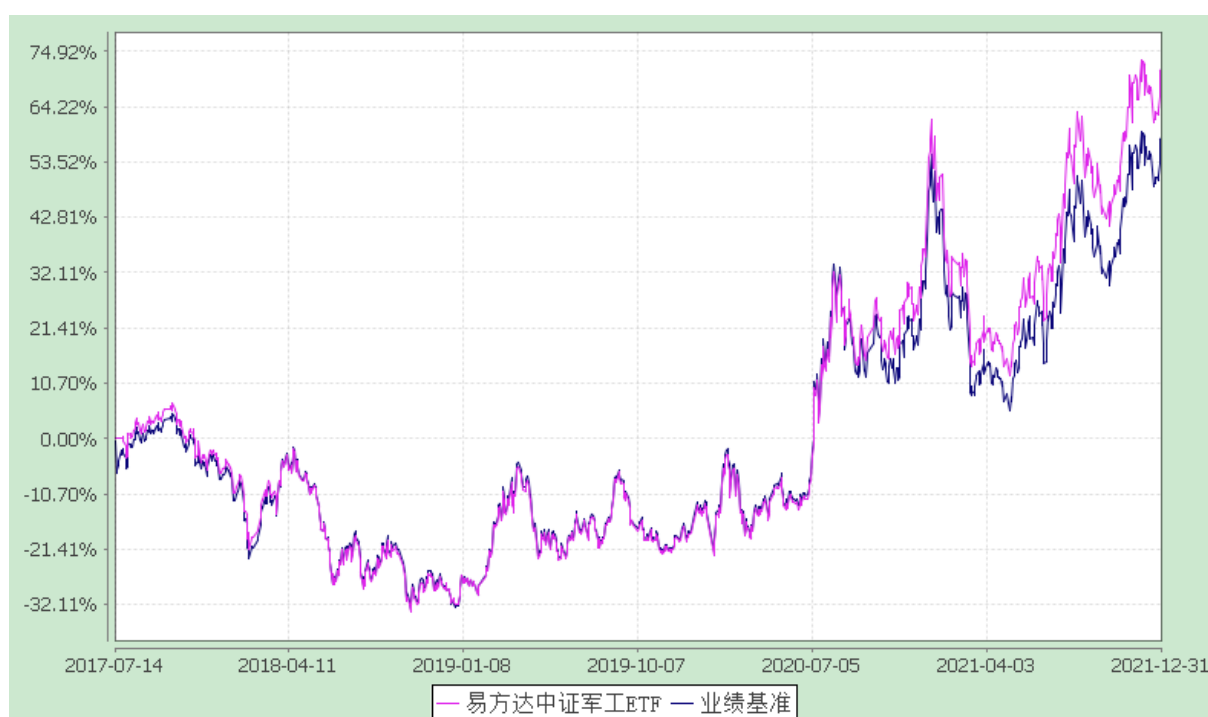
易方达中证军工交易型开放式指数证券投资基金 份额累计净值增长率与业绩比较基准收益率历史走势对比图 (2017年7月14日至2021年12月31日)

注：自基金合同生效至报告期末，基金份额净值增长率为 71.52%，同期业绩比较基准收益率为 58.27%。