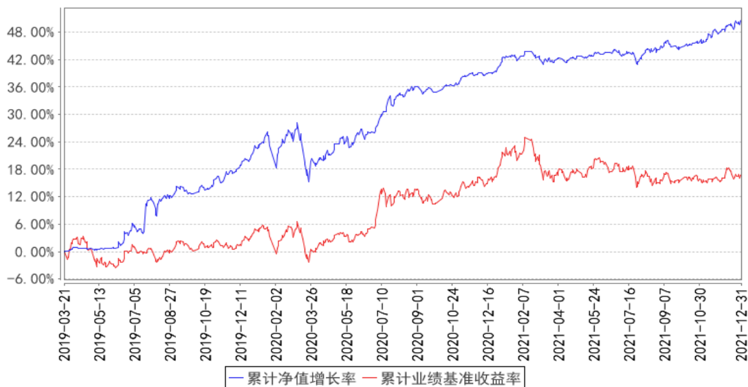
融通通盈灵活配置混合累计净值增长率与同期业绩比较基准收益率的历史走势对比图