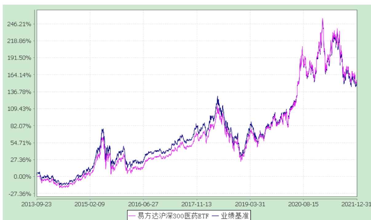
易方达沪深 300 医药卫生交易型开放式指数证券投资基金 份额累计净值增长率与业绩比较基准收益率历史走势对比图 (2013 年 9 月 23 日至 2021 年 12 月 31 日)

注：自基金合同生效至报告期末，基金份额净值增长率为 153.20%，同期业绩比较基准收益率为 148.49%。