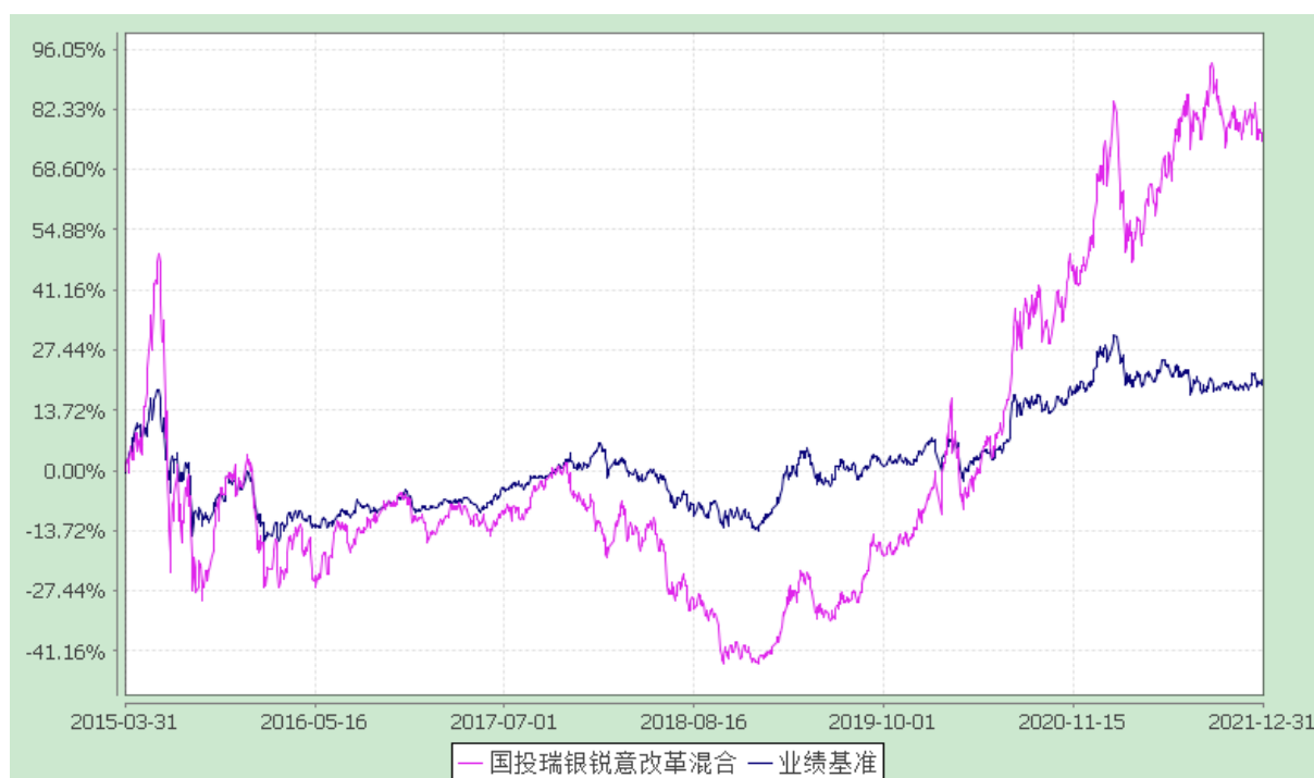
国投瑞银锐意改革灵活配置混合型证券投资基金 份额累计净值增长率与业绩比较基准收益率的历史走势对比图 (2015 年 3 月 31 日至 2021 年 12 月 31 日)

注：本基金建仓期为自基金合同生效日起的六个月。截至本报告期末，本基金各项资产配置比例符合基金合同及招募说明书有关投资比例的约定。