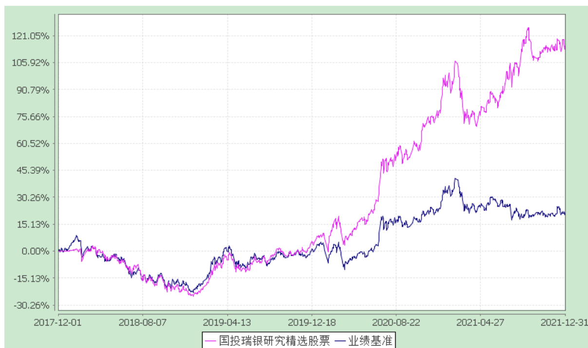
国投瑞银研究精选股票型证券投资基金 份额累计净值增长率与业绩比较基准收益率的历史走势对比图 (2017 年 12 月 1 日至 2021 年 12 月 31 日)

注：本基金建仓期为自基金合同生效日起的六个月。截至建仓期结束，本基金各项资产配置比例符合基金合同及招募说明书有关投资比例的约定。