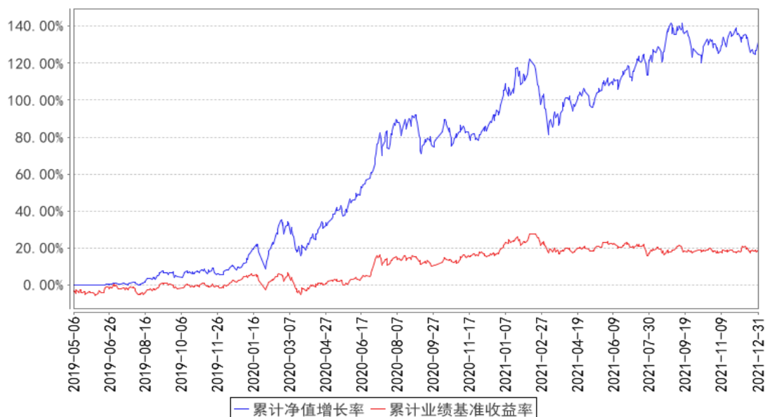
鹏华研究智选混合累计净值增长率与同期业绩比较基准收益率的历史走势对比图