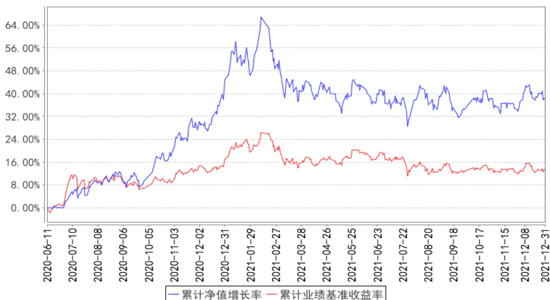
鹏华优质企业混合累计净值增长率与同期业绩比较基准收益率的历史走势对比图

注：1、本基金基金合同于 2020 年 06 月 11 日生效。2、截至建仓期结束，本基金的各项投资比例已达到基金合同中规定的各项比例。