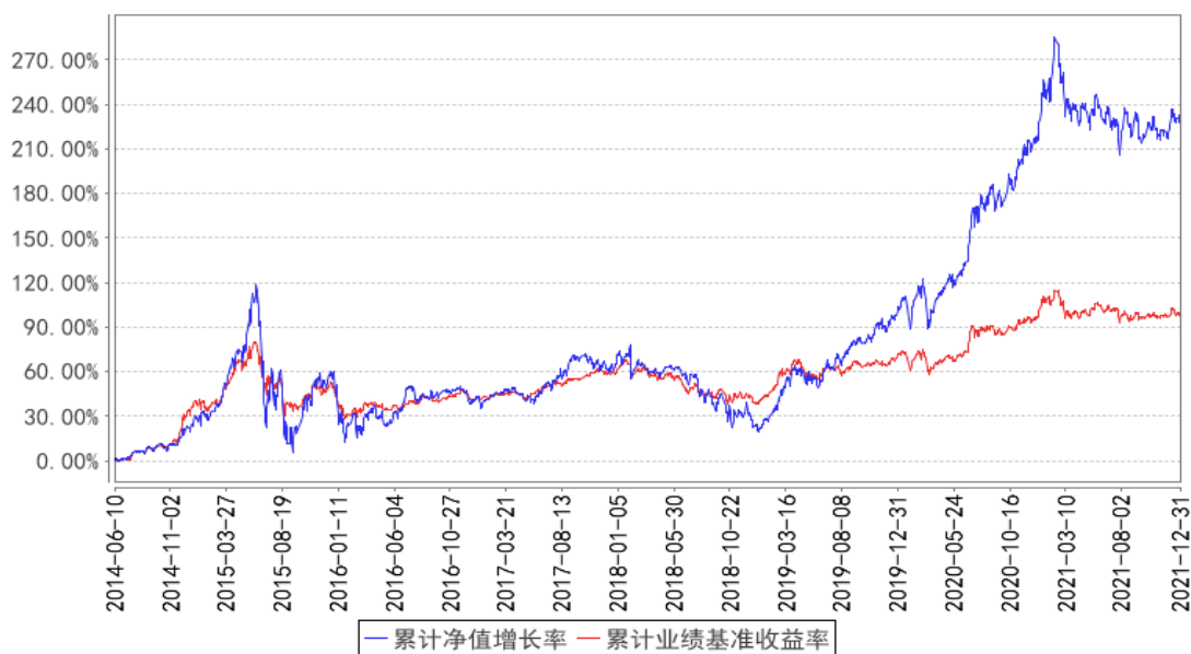
鹏华策略优选混合累计净值增长率与同期业绩比较基准收益率的历史走势对比图

注：1、本基金基金合同于 2014 年 06 月 10 日生效。2、截至建仓期结束，本基金的各项投资比例已达到基金合同中规定的各项比例。