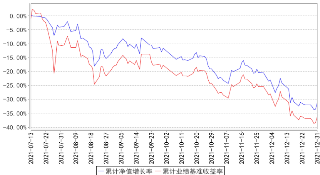
香港医药累计净值增长率与同期业绩比较基准收益率的历史走势对比图

注：1、本基金基金合同于 2021 年 07 月 13 日生效，截至本报告期末本基金基金合同生效未满一年。2、本基金管理人将严格按照本基金合同的约定，于本基金建仓期届满后确保各项投资比例符合基金合同的约定。