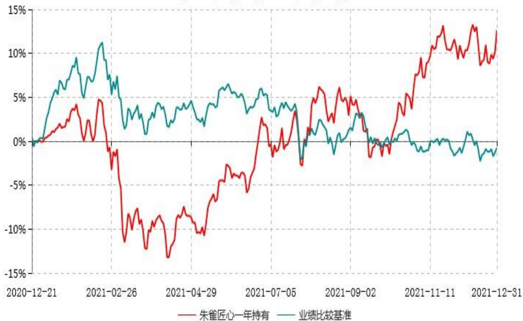
朱雀匠心一年持有期混合型证券投资基金累计净值增长率与业绩比较基准收益率历史走势对比图 (2020年12月21日-2021年12月31日)