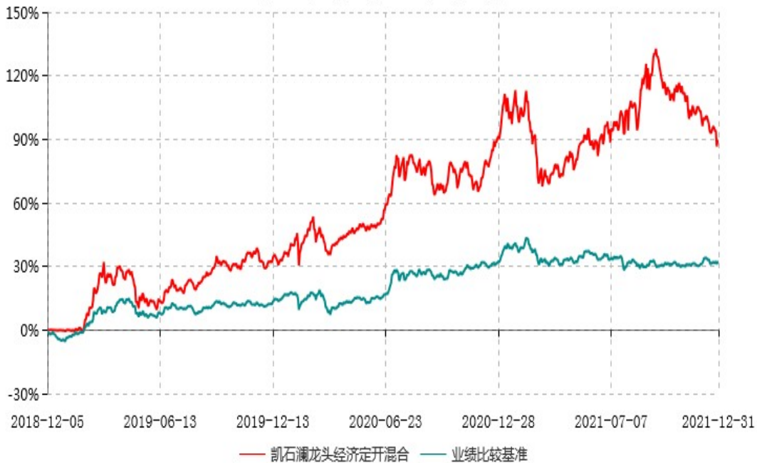
凯石澜龙头经济定期开放混合型证券投资基金累计净值增长率与业绩比较基准收益率历史走势对比图 (2018年12月05日-2021年12月31日)