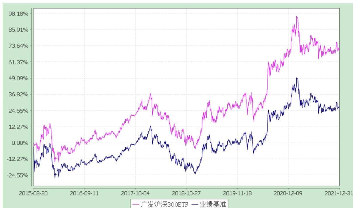
广发沪深 300 交易型开放式指数证券投资基金 份额累计净值增长率与业绩比较基准收益率的历史走势对比图 (2015 年 8 月 20 日至 2021 年 12 月 31 日)