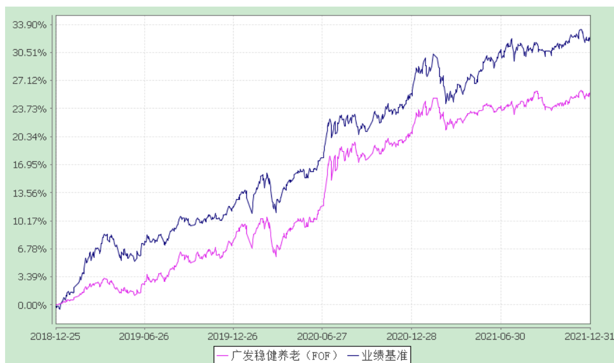
广发稳健养老目标一年持有期混合型基金中基金（FOF） 份额累计净值增长率与业绩比较基准收益率历史走势对比图 （2018 年 12 月 25 日至 2021 年 12 月 31 日）