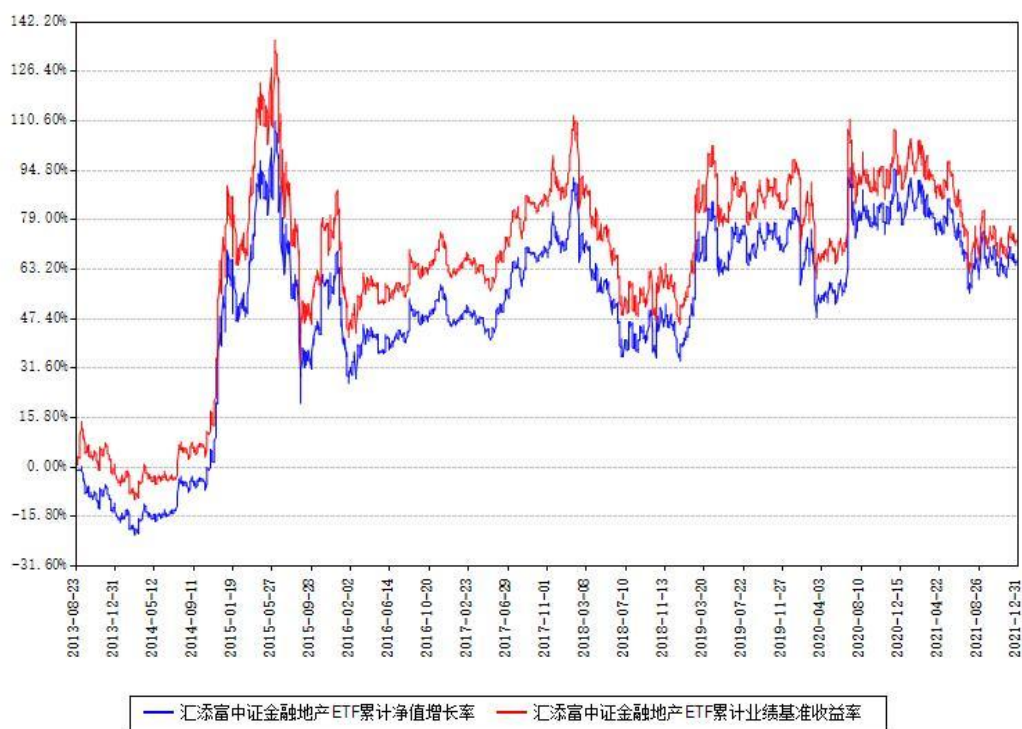
汇添富中证金融地产ETF累计净值增长率与同期业绩基准收益率对比图

注：本基金建仓期为本《基金合同》生效之日（2013年08月23日）起3个月，建仓期结束时各项资产配置比例符合合同约定。