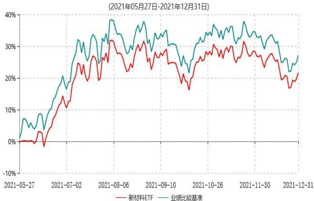
天弘中证新材料主题交易型开放式指数证券投资基金累计净值增长率与业绩比较基准收益率历史走势对比图

注：1、本基金合同于2021年05月27日生效，本基金合同生效起至披露时点不满1年。