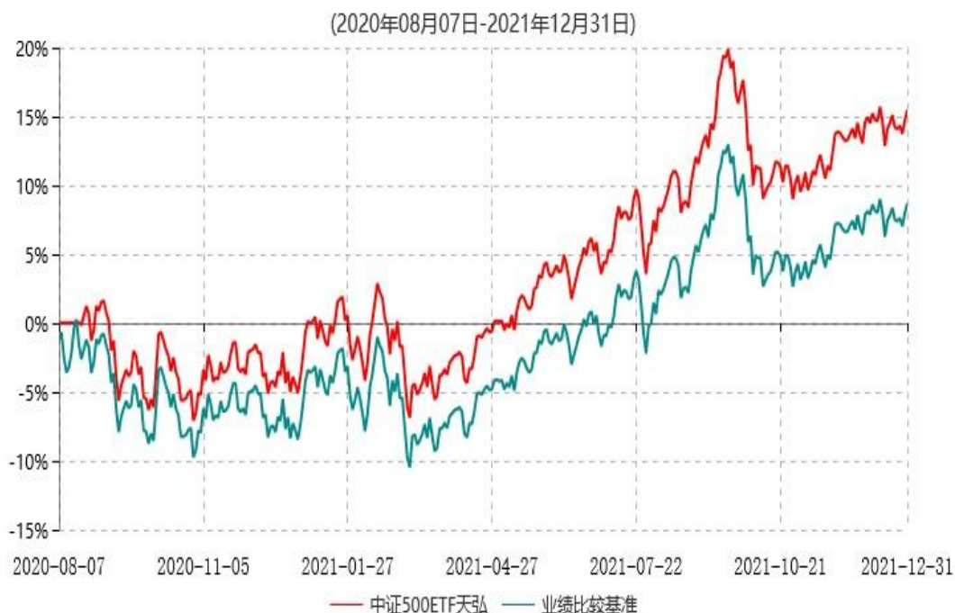
天弘中证500交易型开放式指数证券投资基金累计净值增长率与业绩比较基准收益率历史走势对比图