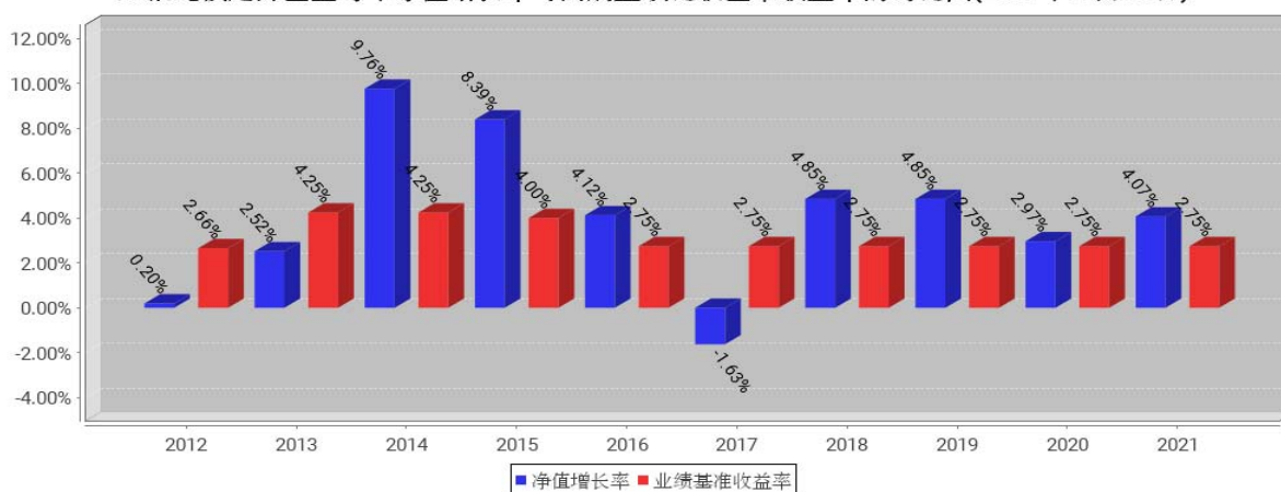
工银纯债定开基金每年净值增长率与同期业绩比较基准收益率的对比图(2021年12月31日)

注:1、本基金基金合同于2012年06月21日生效。合同生效当年不满完整自然年度的,按实际期限计算净值增长率。