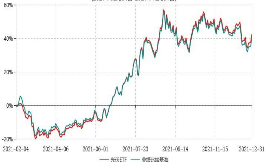
天弘中证光伏产业交易型开放式指数证券投资基金累计净值增长率与业绩比较基准收益率历史走势对比图 (2021年02月04日-2021年12月31日)